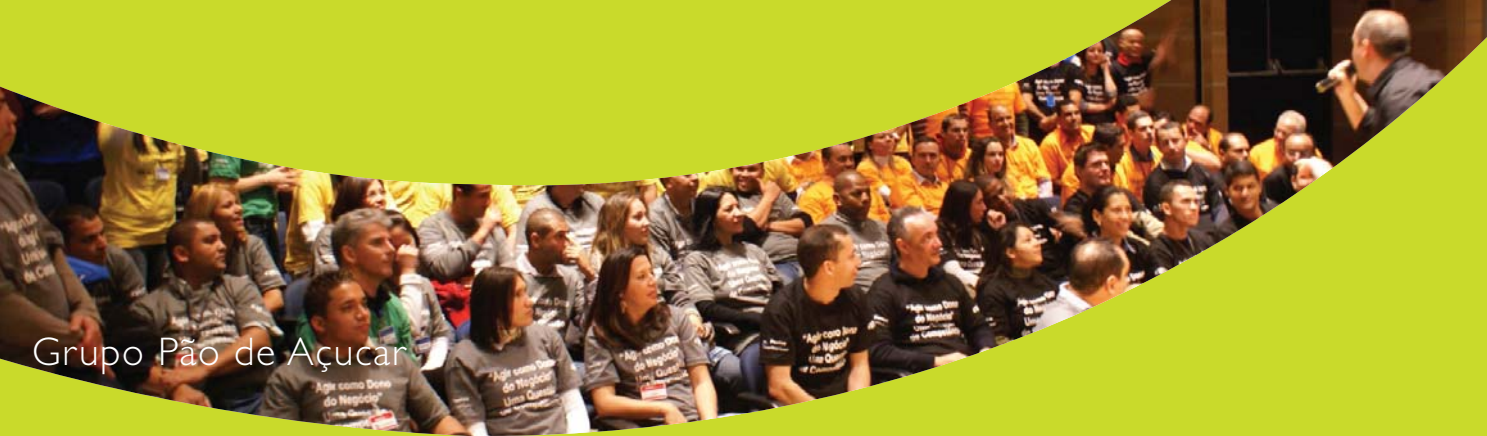
Grupo Pão de Açúcar

Na consultoria, planejamento, elaboração e realização de jogos corporativos, dinâmicas de grupo, atividades de integração, games e quiz, intervenções temáticas, warm up, circuitos cooperativos, campeonatos e vivências esportivas, construímos sempre uma relação coerente com os nossos atributos.