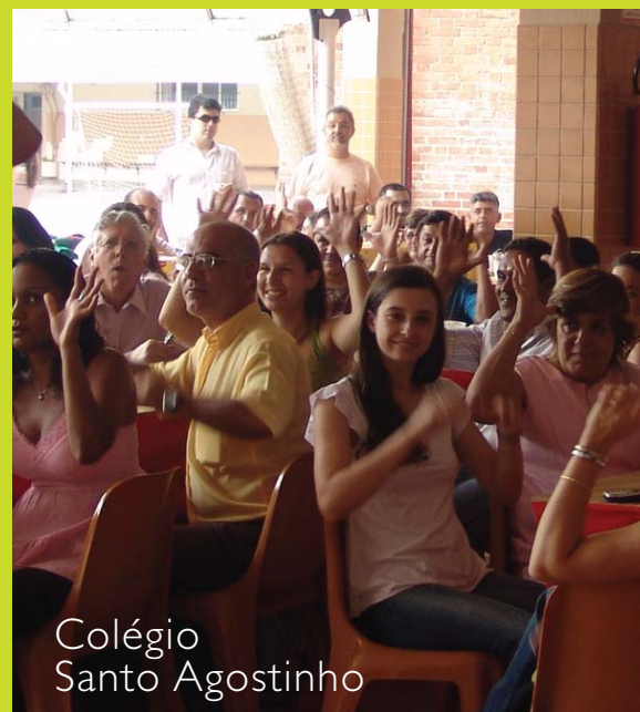
Colégio Santo Agostinho