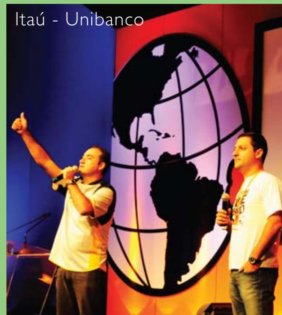
Itaú - Unibanco