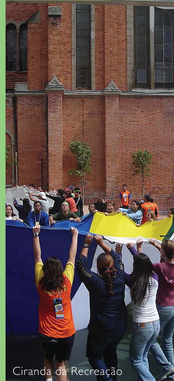
Ciranda da Recreação