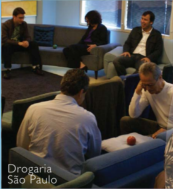
Drogaria São Paulo