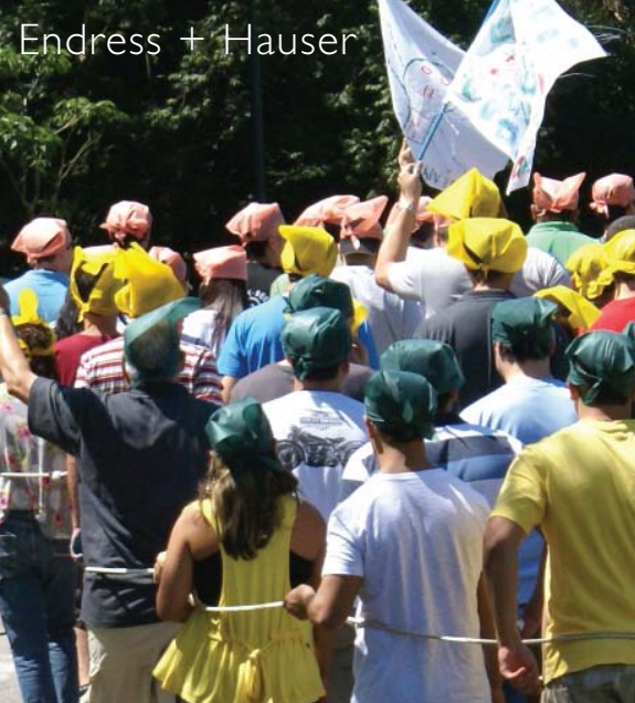
Endress + Hauser