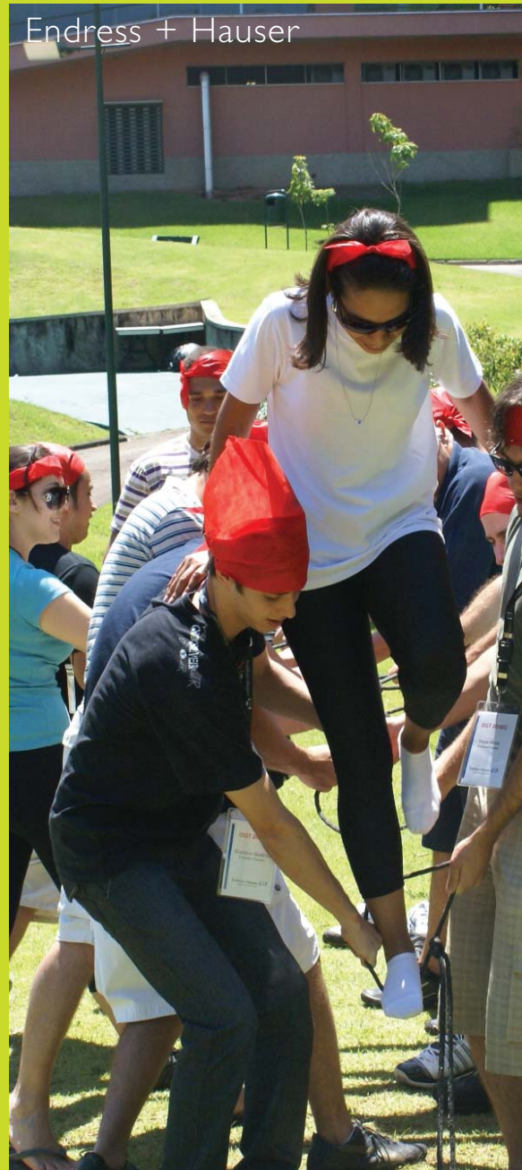
Endress + Hauser